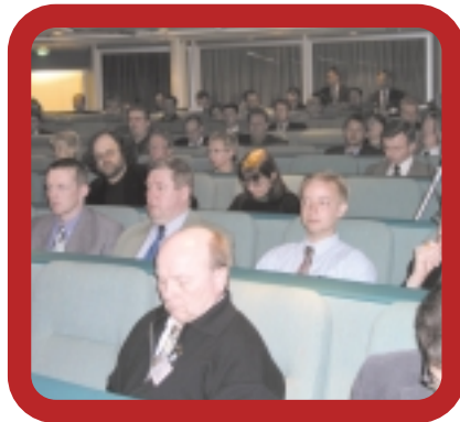
2004 Suomen Seutuverkot ry kevätseminaari