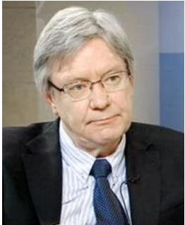
Tietosuojavaltuutettu Reijo Aarnio

http://ec.europa.eu/newsroom/article29/news-overview.cfm