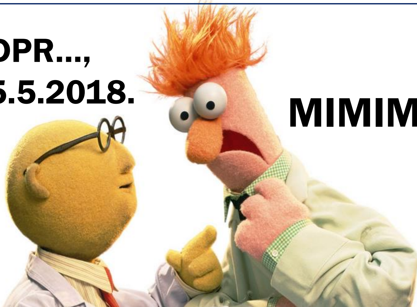
Dr, Bunsen Honeydew